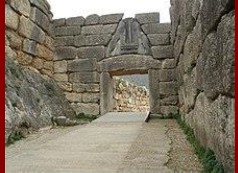
Η Πύλη των Λεόντων στις Μυκήνες

Στην ταφική αρχιτεκτονική κυριαρχούν τρεις τύποι τάφων: ο λακκοειδής, ο λαξευτός θαλαμοειδής ή θαλαμωτός και ο θολωτός. Οι θολωτοί τάφοι συγκαταλέγονται χωρίς αμφιβολία στα πιο λαμπρά και εντυπωσιακά αρχιτεκτονήματα του Μυκηναϊκού Πολιτισμού.