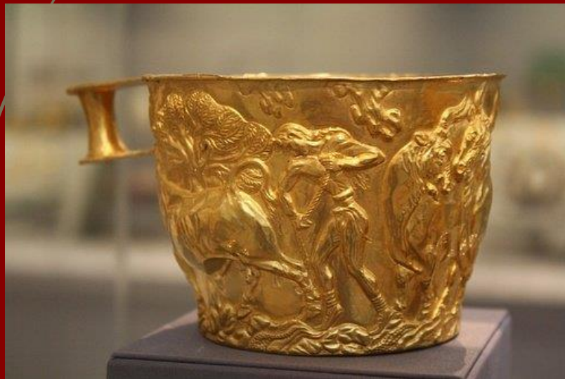
► Χρυσό κύπελλο από το Βαφειό

Οι Μυκηναίοι κοσμηματοποιοί χρησιμοποίησαν χρυσό, γυαλί, φαγεντιανή, ημιπολύτιμους και πολύτιμους λίθους (π.χ. καρνελιανό, αχάτη, ορυκτό κρύσταλλο) και ήλεκτρο για να δημιουργήσουν περιδέραια, περίαπτα, δαχτυλίδια, ενώτια, περόνες, πόρπες και διαδήματα. Χρησιμοποιούσαν το πλήρες φάσμα των τεχνικών της μεταλλουργίας, ακόμα και την επισμάλτωση, την οποία οι Μινωίτες δεν είχαν τελειοποιήσει. Οι γυάλινες χάντρες διαμορφώνονταν, σκαλίζονταν και κατασκευάζονταν με εκμαγεία.