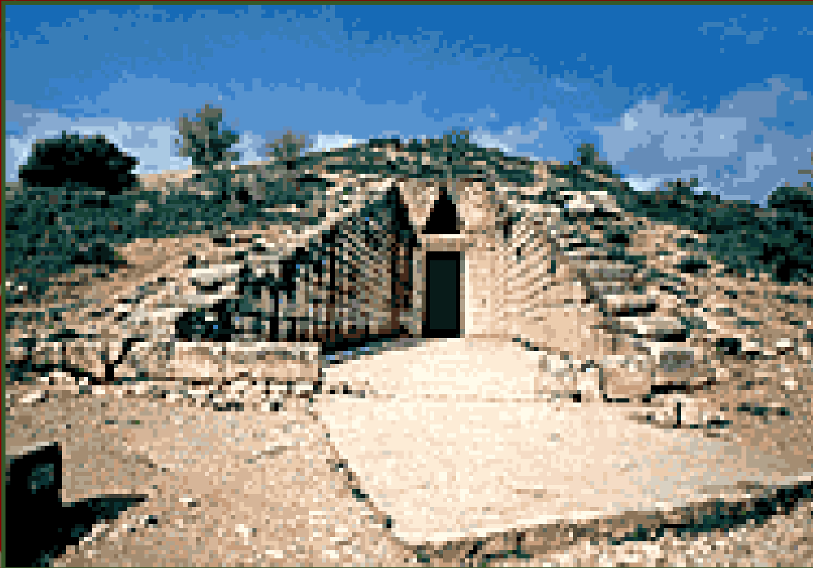
Μυκήνες. Θολωτός τάφος, γνωστός ως "θησαυρός του Ατρέως"

Οι θολωτοί τάφοι είναι υπόγεια κυκλικά κτίσματα που αποτελούνται από την κυρίως θόλο και ένα μακρύ δρόμο . Το χτίσιμο των θόλων γινόταν με λιθόπλινθους που τοποθετούνταν σε σειρές κατά το εκφορικό σύστημα. Ο ταφικός αυτός τύπος προήλθε μάλλον από την Κρήτη, όπου υπήρχε ήδη από την Πρωτομινωική εποχή (3000-2000 π.Χ) και μεταδόθηκε στην ηπειρωτική Ελλάδα κατά το τέλος της Υστεροελλαδικής Ι περιόδου (1550-1500 π.Χ.) μέσω της Μεσσηνίας, όπου έχουν βρεθεί τα πρωιμότερα παραδείγματα. Κατά μια διαφορετική άποψη, οι θολωτοί τάφοι δεν είναι παρά μια λιθόχτιστη εκδοχή του ελλαδικού τύμβου.