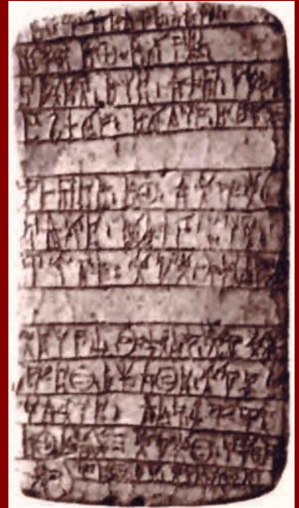
Πήλινη πινακίδα με κείμενο της γραμμικής Β' γραφής.